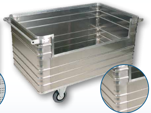
Modell D 3808 / 945