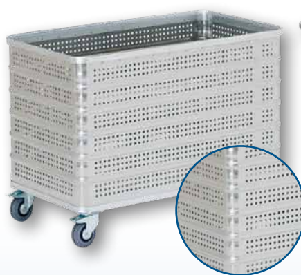
Modell D 3008 / 430 P