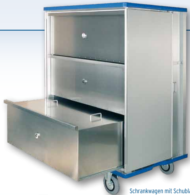
Schrankwagen mit Schubladen auf Teleskop-Auszügen