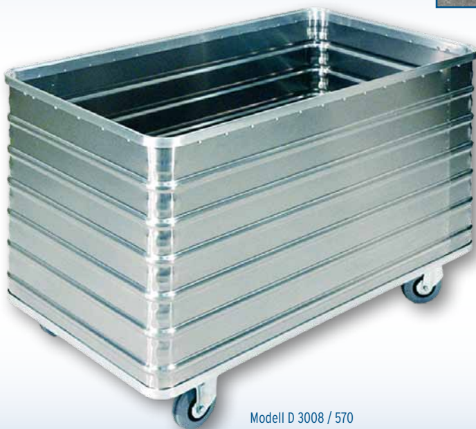
Modell D 3008 / 570