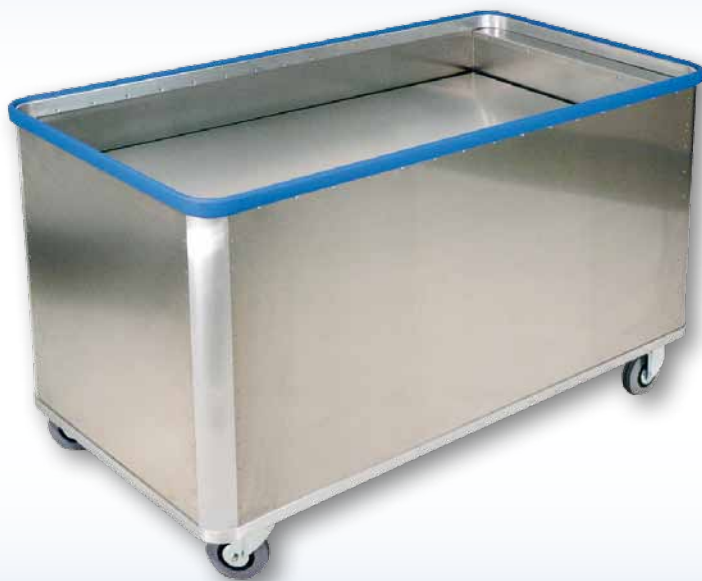
Modell D 5408 / 580