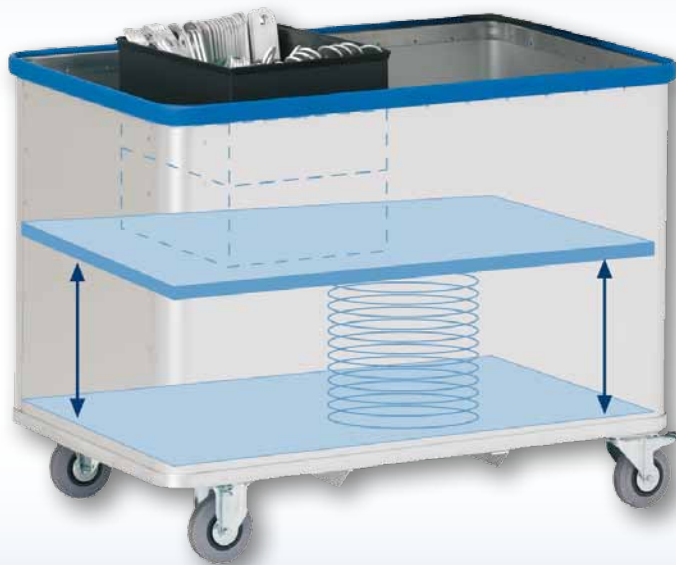
Modell D 1408 / 350 - eloxiert

Der lastabhängig, fliegend aufgehängte Boden wird in Spezialprofilen einer Wagen-Stirnseite verkantungsfrei geführt. 8 kugelgelagerte Rollen sorgen für eine präzise Parallelbewegung des Federbodens. Glatte Wände reduzieren die Reibung des Ladegutes und begünstigen die sofortige Reaktion des Federbodens auf Gewichtsveränderung.