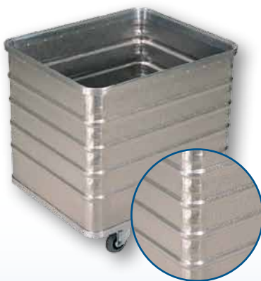
Modell D 3008 / 240